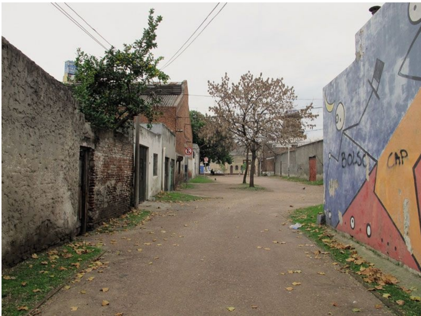
Het achterafstraatje annex 'voetbalveld' in Montevideo waar ik als kind iedere dag speelde. Zo ziet het er tegenwoordig uit, vanaf de citroenboom tot de vrouwengevangenis.