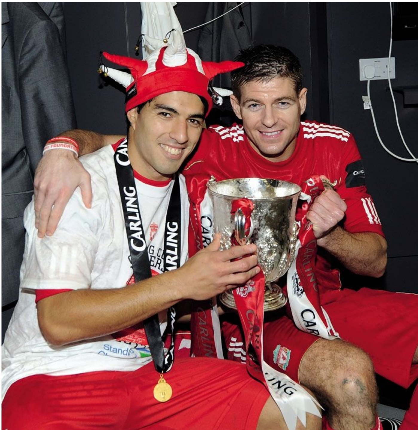
Captain Fantastic. Feestje met Stevie na het winnen van de Carling Cup. Als tiener verafgoodde ik hem en nu heb ik een gesigneerd shirt van hem aan de muur hangen.