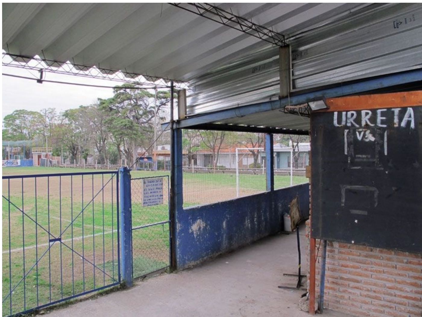
Urreta FC, de club waar ik mijn eerste transferperikelen beleefde. Ik vertrok naar Nacional nadat we kort hadden gesteggeld over of ik mijn voetbalspullen moest teruggeven.