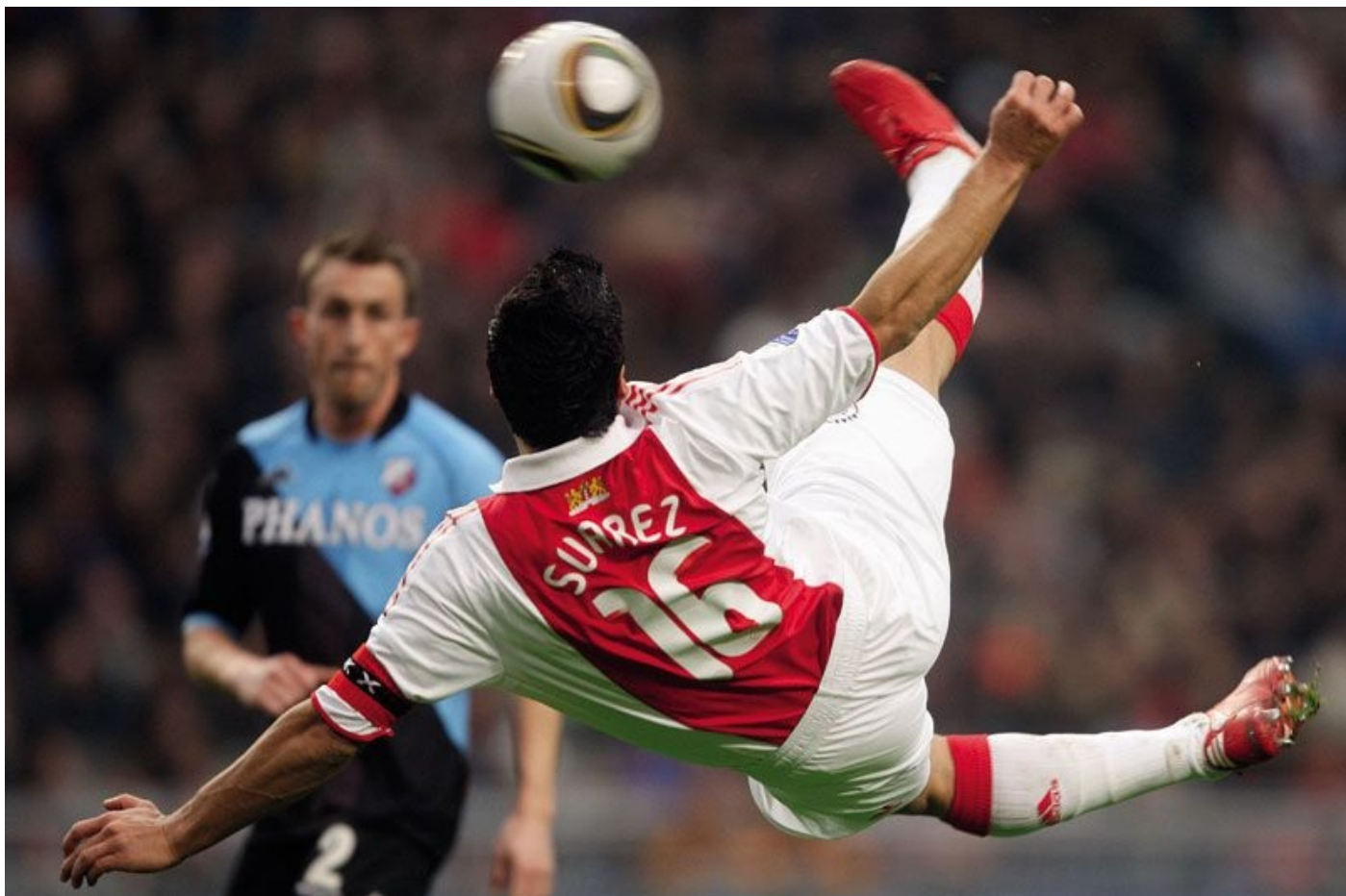
Spectaculaire omhaal in het beroemde rood-witte shirt.