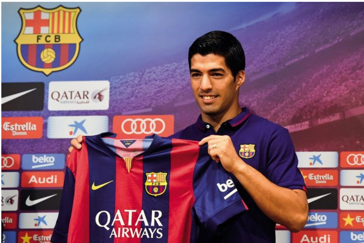
Eindelijk gepresenteerd als Barcelonaspeler.