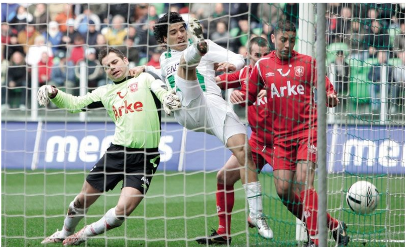
Mijn eerste club in Europa, FC Groningen. Ze bejubelden mijn doelpunten, en vervolgens verbrandden ze mijn shirt.