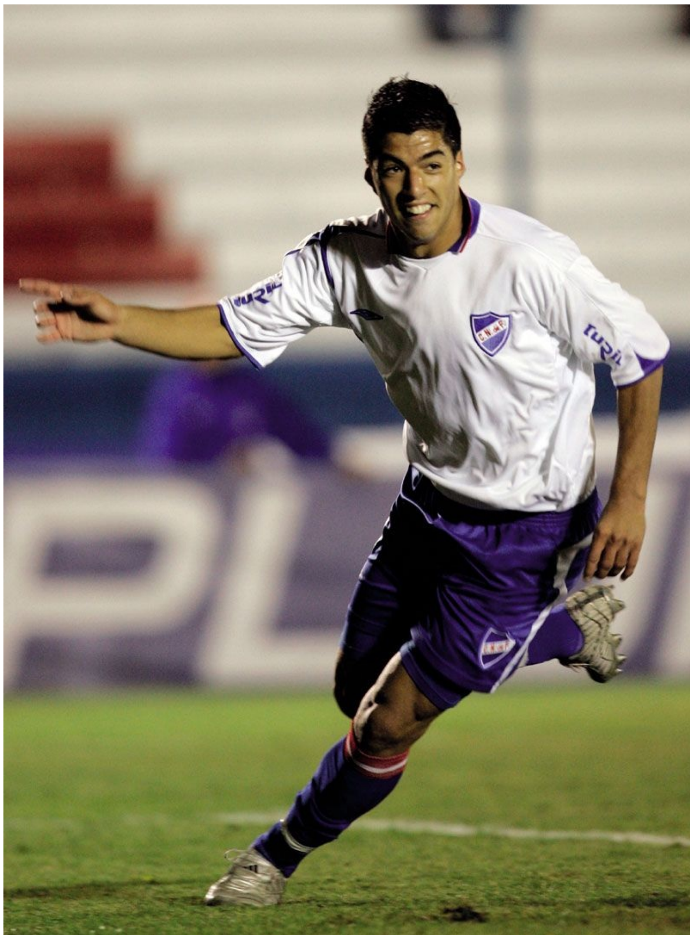
Boven en links: Spelend voor Nacional, de club waar ik mijn hele leven al supporter van was en die me mijn eerste profcontract aanbod.