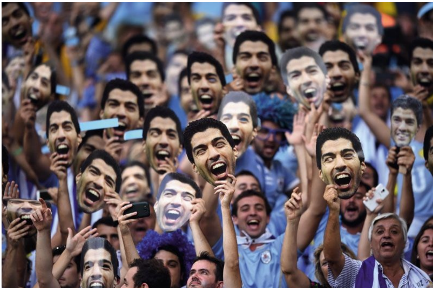
De geweldige Uruguayaanse supporters bleven in Brazilië achter me staan, zelfs nadat ik naar huis was gestuurd.