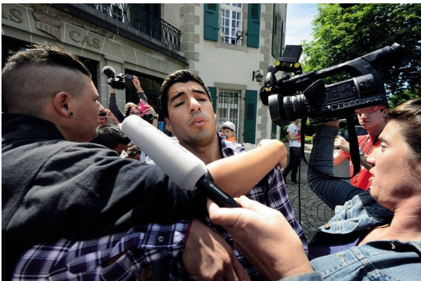
Me een weg banend naar het Hof van Arbitrage. Het was het waard: ze maakten mijn schorsing voor alle voetbalactiviteiten ongedaan.