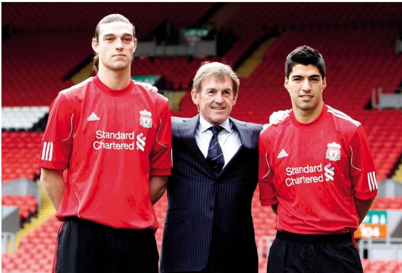
Met King Kenny op Anfield. Samen met de andere nieuwe aanwinst, Andy Carroll, sta ik naast de beroemdste nummer 7 aller tijden van Liverpool.