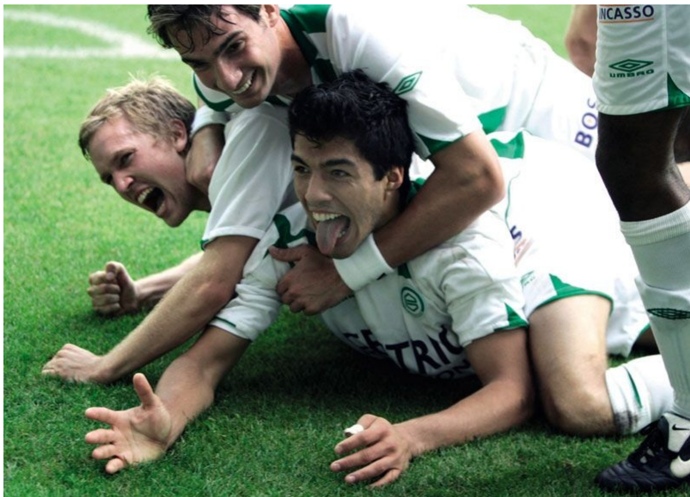
Feestje na een doelpunt tegen FC Twente.